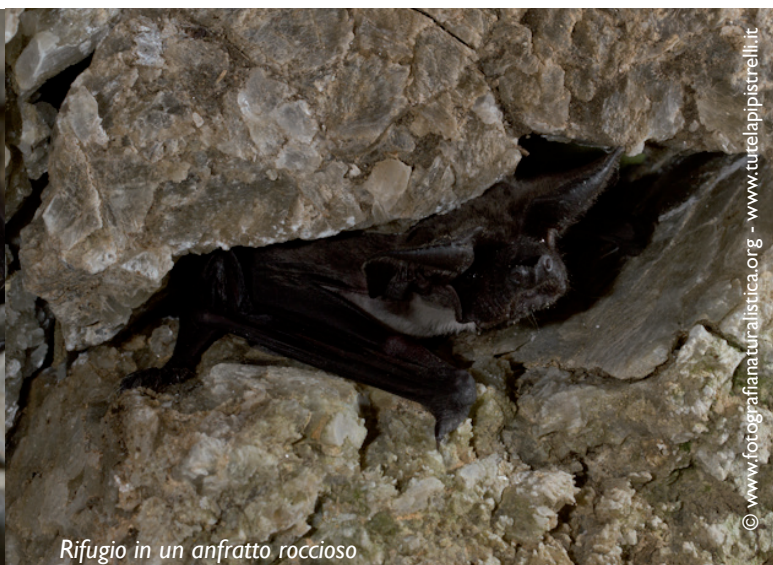
Rifugio in un anfratto roccioso