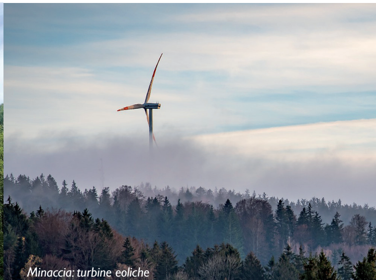
Minaccia: turbine eoliche