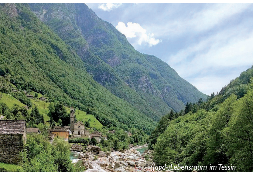
(Jagd-)Lebensraum im Tessin