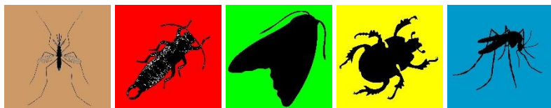
Schnake Ohrgrübler Nachtfalter Mistkäfer Stechmücke