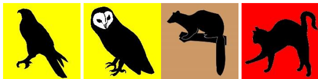
Baumfalke Schleiereule Steinmarder Katze