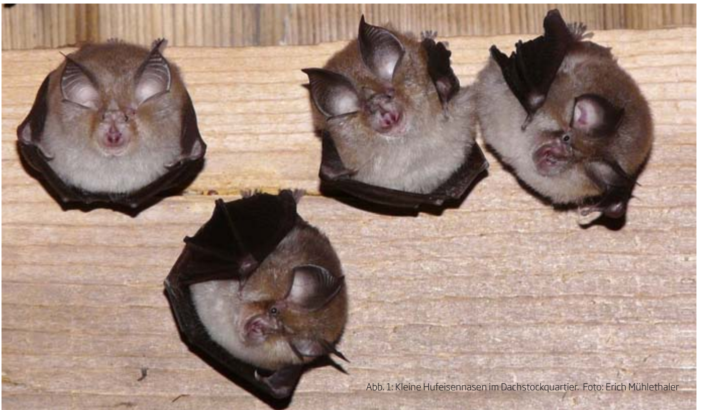
Abb. 1: Kleine Hufeisennasen im Dachstockquartier.

Eine fledermausbegeisterte Eigentümerin eines schönen alten Hauses in Waltensburg nahm an den letztjährigen Infrarot-Videodirektübertragungen der Kleinen Hufeisennasen in Uors und der Mausohren in Laax teil. Sie erwähnte dabei beiläufig, dass sie zuhause auch einen «Estrich voller frei hängender Fle-