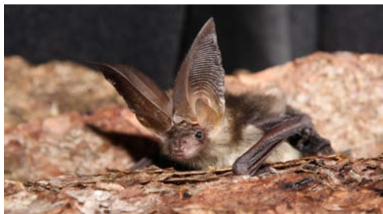
Abb. 9: Braunes Langohr ( Plecotus auritus ).

(Werkstatt) zugänglich gemacht. Dieser Dachstock wurde aber leider von den Langohren nicht genutzt. So ist nicht bekannt, wo sich die Langohren im Sommer 2011 aufhielten. Kontrollen im 2012 ergaben erste Kotspuren von Langohren im für die Fledermäuse ausgesparten Estrichraum. Diese lassen hoffen, dass die Langohren im vergangenen Jahr das «neue» Quartier zumindest besichtigt haben und es in den nächsten Jahren wieder besiedeln werden. Neben dem Hauptquartier steht den Langohren oder allenfalls auch anderen Fledermausarten zusätzlich der Dachstockraum über der Werkstatt offen. Mittlerweile ist der Umbau gänzlich abgeschlossen, so dass keine Störungen mehr auftreten. Die KFB wird das Quartier regelmässig auf die Wiederbesiedlung durch die Langohren überprüfen. ML