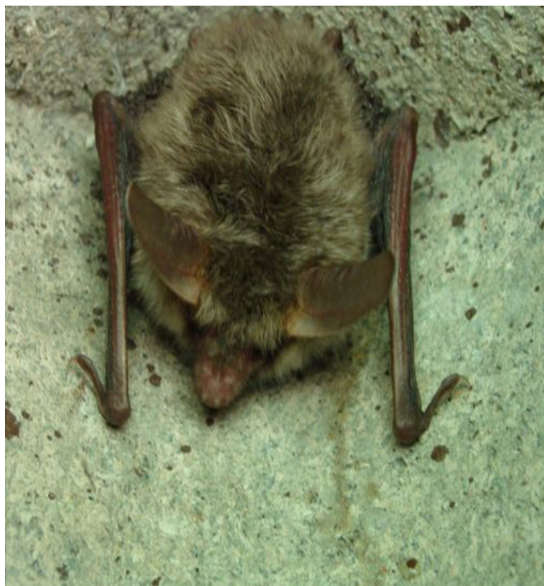
Abb. 7: Bechsteinfledermaus ( Myotis bechsteinii ).

Am 13. August 2012 entdeckte der Wildhüter Renato Roganti bei der Kontrolle eines Vogelnistkastens (Holzbetonkasten) in einer Kastanienselve bei Castasegna (790m ü.M.) im Bergell unverhofft eine Fledermaus mit auffällig langen, voneinander getrennt stehenden Ohren und schlanker Schnauze. Anhand des Fotobelegs konnte das Tier nachträglich einwandfrei als Bechsteinfledermaus bestimmt werden. Es handelt sich erst um den dritten Nachweis dieser sehr seltenen Art in GR und gleichzeitig um deren zweiten Nachweis im Bergell. Exakt ein Jahr zuvor (am 13.8.11) hatte derselbe Wildhüter erstmals eine Bechsteinfledermaus im Bergell in einem Vogelnistkasten in Soglio (940m ü.M.) gefunden und fotografisch dokumentiert. Der erste Bündner Nachweis dieser Fledermausart überhaupt liegt mehr als 20 Jahre zurück und stammt aus Brusio (720m) im Puschlav. EM