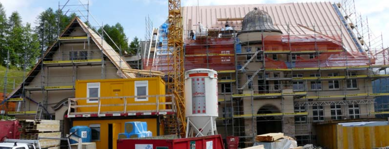
Abb. 8: Physikalisch-Meteorologisches Observatorium Davos (PMOD), Wochenstubenquartier einer grossen Langohrkolonie (Bild: Sommer 2011). Die Umbau- und Renovationsarbeiten im Dachstockbereich begannen im Frühjahr 2011 und wurden im Frühjahr 2012 fertiggestellt.