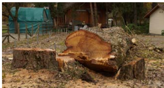
Abb. 3: Gefällte Pappel.

Am Donnerstag, den 8.11.2012, wurde im Pulvermühleareal der Stadt Chur eine hohe Pappel gefällt. Niemand wusste, dass eine Baumhöhle an einem Ast der Pappel von Grossen Abendseglern besiedelt war. Mindestens 15 Tiere, mehrheitlich Männchen, hatten sich darin für den Winterschlaf eingerichtet. Die mit dem Fällen beschäftigten Arbeiter wurden von den Fledermäusen überrascht. Sie sammelten die Tiere ein, legten sie mit Handschuhen vorsichtig in eine Schachtel und nahmen