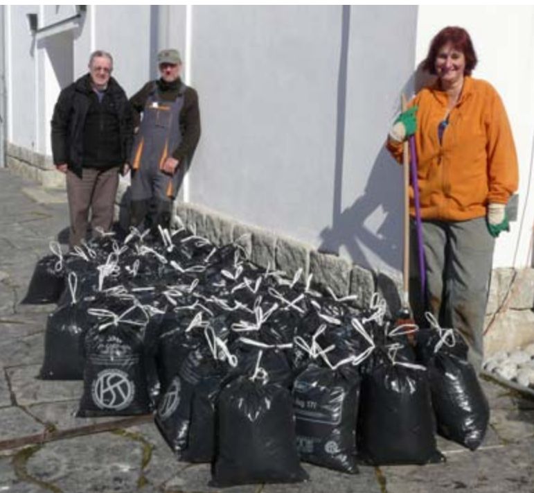
Abb. 6: LFS-Equipe mit dem Ergebnis der Dachstockputzete.

Der Fledermausschutz organisiert jeden Winter turnusgemäss in einzelnen grossen Wochenstubenquartieren Putzaktionen. Dabei werden die im Dachstock anfallenden Kotchegele-Haufen zusammen genommen, in Säcke gefüllt und falls möglich in der Landwirtschaft als wertvoller Dünger weiter verwendet. Die Dachstock-Reinigung ist wichtig zur Erhaltung der Quartierstruktur. Bei der weit über 900 erwachsene Mausohren zählenden Wochenstubenkolonie in Surrein kam eine beträchtliche Menge an Fledermausdünger zusammen: 67 Säcke à 17 l wurden mit Kotchegele gefüllt. Dies ist nicht überaus erstaunlich, wenn man bedenkt, dass Fledermäuse jede Nacht sehr grosse Mengen an Insekten fressen. Pro Nacht kann ein Mausohr bis zur Hälfte seines Körpergewichtes fressen. Rechnet man das in Maikäferinheiten um, kann ein Mausohr in einer guten Nacht im Mai bis zu 30 Maikäfer vertilgen. Die ganze Wochenstubenkolonie verspeist in einem Sommer eine kaum vorstellbare Menge an Insekten. Diese kostenlose natürliche Insektenbekämpfung wiegt die Untermiete der flatterhaften Bewohner im Kirchendachstock mehr als nur auf. ML