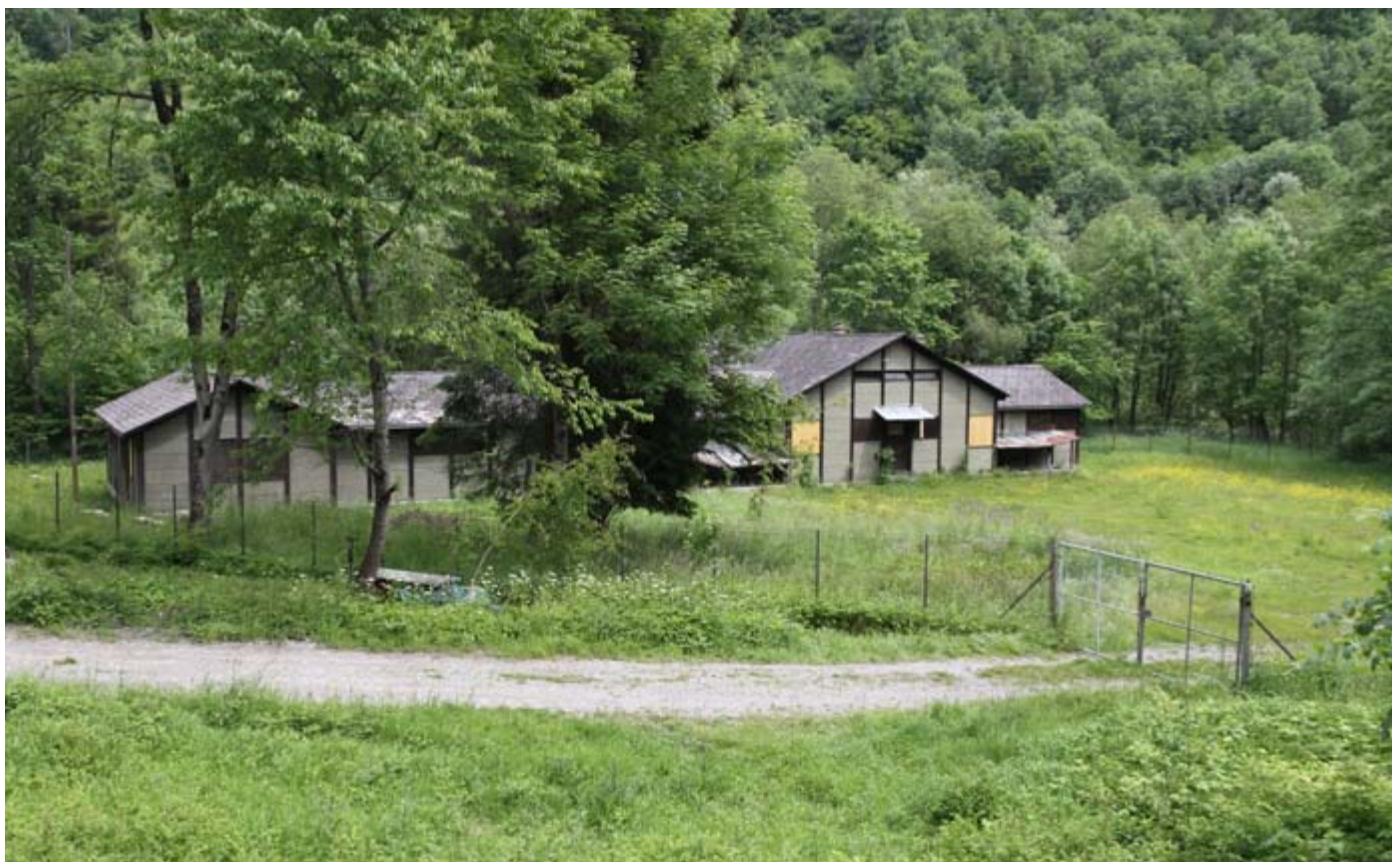
Abb. 4: Altes Militärspital Ilanz nach Fertigstellung der Renovationsarbeiten.

Die Kolonie der Kleinen Hufeisennase im alten Militärspital Ilanz wurde vom Fledermausschutz Graubünden im Herbst 2002 entdeckt. Die Lokale Fledermausschützerin, Susanne Zinsli, beobachtete die ausfliegenden Tiere und konnte sie mit Hilfe des Ultraschall-Detektors sogleich als Kleine Hufeisennasen identifizieren. Eine nachfolgende Kontrolle des Gebäudes bestätigte die Beobachtung. Seit Frühjahr 2003 wurde der Bestand der Kolonie durch die Lokale Fledermausschützerin regelmässig erfasst. Nach 10 Jahren Bestandsüberwachung zeigt sich ein sehr erfreuliches Bild.