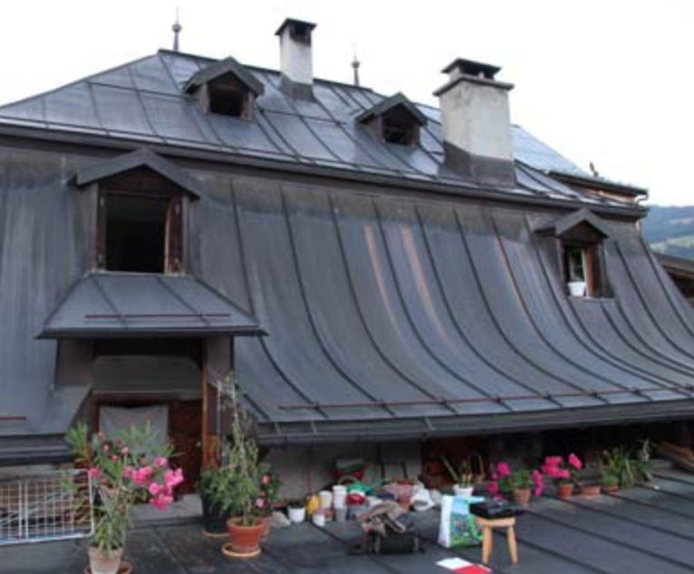
Abb. 2: Neu entdecktes Wochenstubenquartier der Kleinen Hufeisennase in Waltensburg. Die Ausflugsöffnung befindet sich zuoberst im Dach links.

im original erhaltenen Dachstock begrüsst uns zahlreiche Kleine Hufeisennasen, die an den dunklen Balken hingen und sich munter um ihre Körperachse drehten oder uns neugierig um die Köpfe schwirrten. Wir zählten deutlich mehr als 80 erwachsene Tiere am Hangplatz, wobei sich ein Teil der Tiere in irgendwelchen Winkeln des Estrichs versteckte.